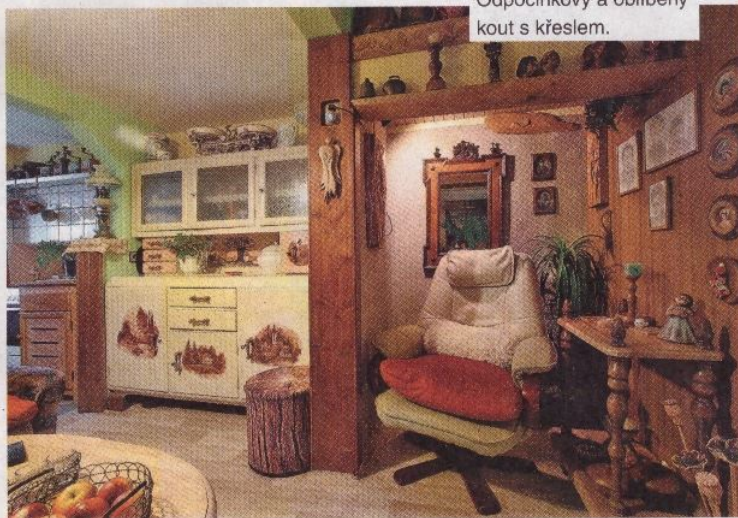
Odpočinkový a oblíbený kout s křeslem.

vánoční zážitek s malým návštěvníkem (někdy jich sem přijíždějí i plné autobusy) s méně poetickou dušičkou: