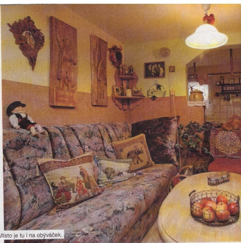
Místo je tu i na obývaček.

Pobavila mě i jiná holčička, když se se mnou dala do řeči při prohlížení zařízeného pokojíčku – venkovské kuchyně – s postavičkami. Že prý tam něco chybí. A já – jak to, vždyť je tam i nočníček pod postelí. A ona, že kamna. A proč tam teda mám komín?! Takže měla pravdu,“ umívá se naše hostitelka, ale dodává i další před-