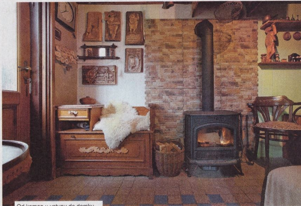
Od kamen u vstupu do domku se teplo rozlévá celým přízemím.