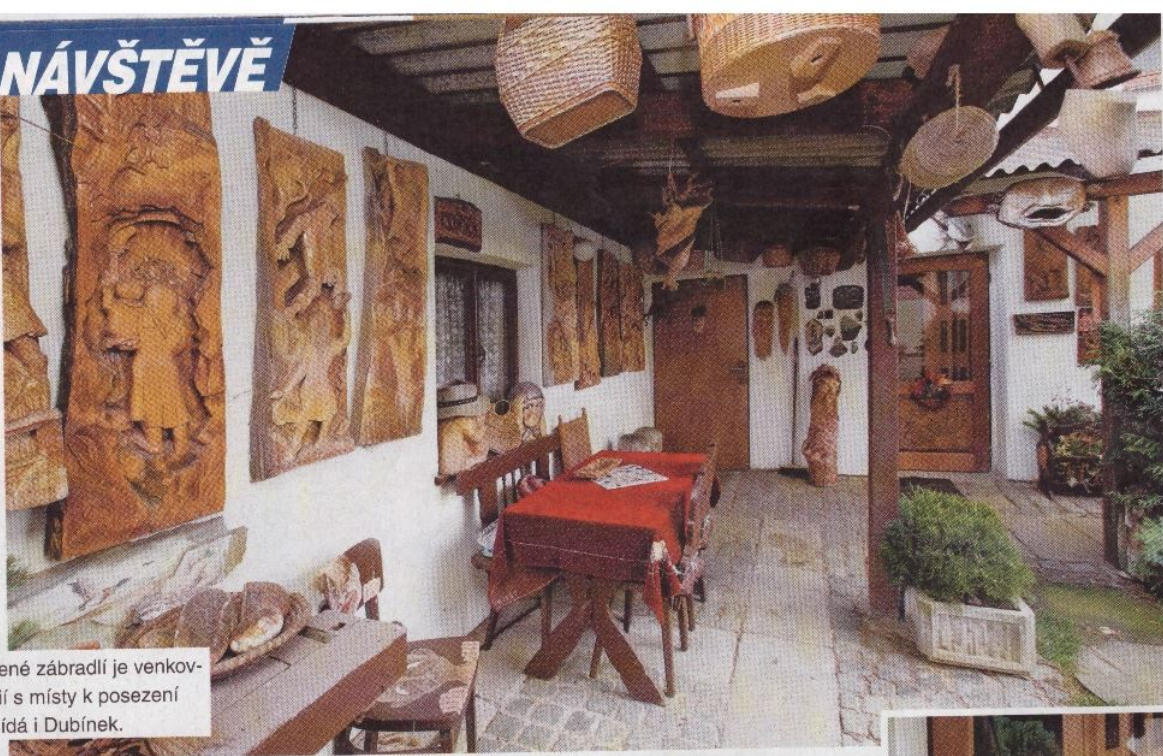
Zastřešené zábradlí je venkovní galerií s místy k posezení a vše hlídá i Dubínek.