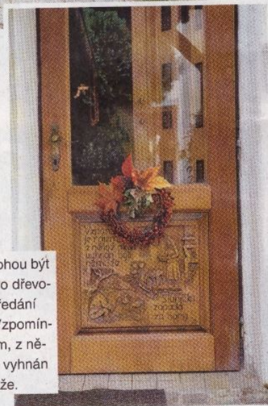
I dveře mohou být místem pro dřevorezbu a předání moudra: Vzpomínka je rájem, z něhož nikdo vyhnán býti nemůže.