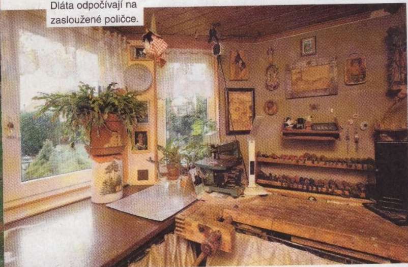
Dláta odpočívají na zasloužené policiče.