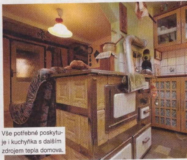
Vše potřebné poskytuje i kuchyňka s dalším zdrojem tepla domova.